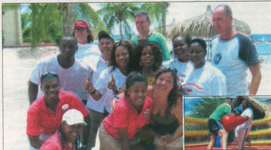
Chata en CTB ontvingen afgelopen zaterdag vertegenwoordigers van de media op Breezes Curaçao voor een gezellige middag 'Cocktails on the Beach'. Behalve cocktails werden ook spelletjes gespeeld, maar was er bovenal veel gezelligheid.